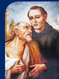
SAN JUAN GRANDE 3 de Junio

Nace en Carmona (Sevilla) el año 1546. A los 19 años se cambia el nombre por "Juan Pecador" y se establece en Jerez de la Frontera (Cádiz) donde se consagró a Dios, dedicándose a la asistencia de los presos, la rehabilitación de las prostitutas y al servicio de los pobres y enfermos incurables. Se integra a la Orden Hospitalaria en 1574. Se distinguió por su extraordinaria misericordia, gran espíritu de oración y sacrificio, considerado: un místico de la Hospitalidad. Muere como víctima de la caridad brindada a los apestados de Jerez en el año 1600. Beatificado por Pío IX el 13 de noviembre de 1853 y lo canonizó el Beato Juan Pablo II el 2 de junio de 1996.