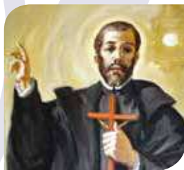
SAN JUAN DE ÁVILA 10 de mayo

Es estimado por la familia hospitalaria por ser el director espiritual de San Juan de Dios. Nace en Ciudad Real en 1499. Su predicación en la Ermita de los Mártires, el 20 de enero de 1539, provocó la conversión de San Juan de Dios y desde ese día lo acompañó en su proceso de discernimiento y realización vocacional. Murió en Montilla (Córdoba) el 10 de mayo de 1569. Beatificado por León XIII en 1894 y Pablo VI lo canoniza el año 1970.