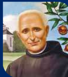
BEATO EUSTAQUIO KUGLER 10 de Junio

Nace el 15 de enero de 1867 en Neuhaus, en la diócesis de Ratisbona. Profesa sus votos religiosos en la Orden Hospitalaria el 21 de octubre de 1895. Religioso de profunda vida interior que le permitió sobrellevar con serenidad los interrogatorios de la Gestapo del III Reich, como también sus sufrimientos de estómago. Fue por 20 años superior local. Muere el 10 de junio de 1946. Beatificado por el papa Benedicto XVI el 4 de octubre del 2009.