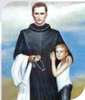
SAN RICARDO PAMPURI 1 de mayo

Nace el 2 de agosto de 1897 en Italia. Bautizado con los nombres Herminio Felipe. En 1921 se graduó con honores en medicina y cirugía en la universidad de Pavia. Ingres a la Orden Hospitalaria en 1927 y toma el nombre de Fray Ricardo.